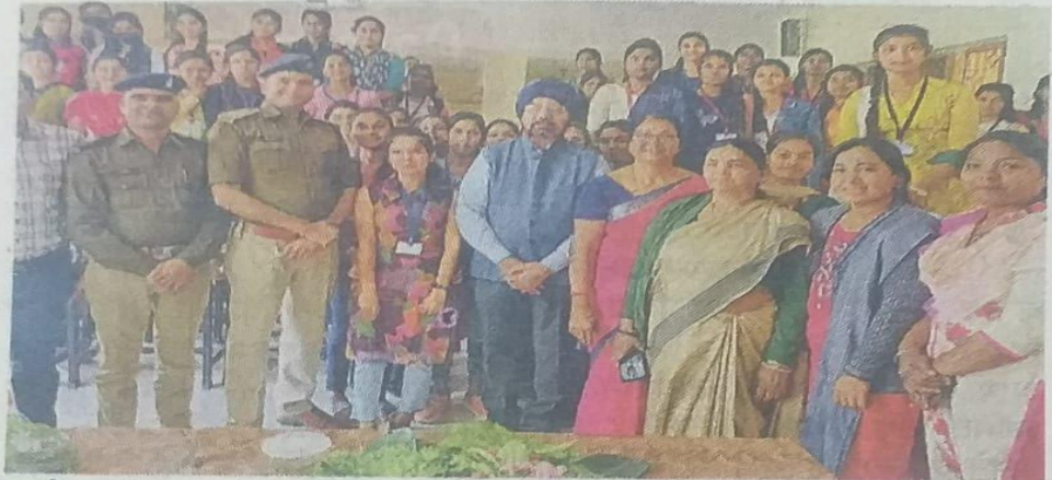
कॉलेज की छात्राएं, शिक्षक व पुलिस अधिकारी मौजूद।

तिमा रण दिवस मोतीलाल नई गई। किया मा पर किया। स्कृतिक ता पाठ श वर्मा चलने सांसद द थे।